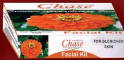
FACIAL KIT FOR BLEMISHED SKIN