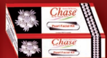
PEARL FACIAL KIT