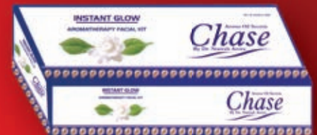
Facial Kit INSTANT GLOW