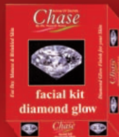
DIAMOND GLOW FACIAL KIT