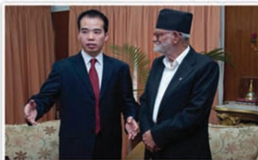
Sushil Koirala (R), PM of Nepal talking with Zhou Shengping, Bureau Chief of Kathmandu-based Xinhua News Agency.

We have an open border with India and we share social, cultural and religious relations with our southern neighbor. Consequently, India is very sensitive to its security. China is also very sensitive about Tibet. In Nepal we are committed not to turn our land into a platform to carry out activities against India and China. We comply with the one-China policy. We do not give in to external pressure. We do not allow our land to be used against our neighbors.