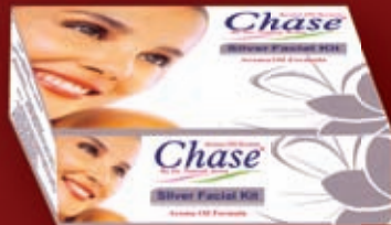
SILVER FACIAL KIT

Get Experienced, Successful, Professional Make Up, Artist/Hair Stylist as your mentor