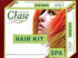
HAIR KIT FOR SPA