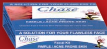
Facial Kit PIMPLE / ACNE PRONE SKIN