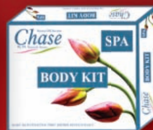
BODY KIT FOR SPA