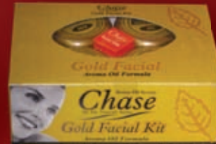
GOLD FACIAL KIT