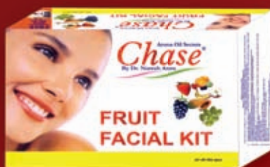
FRUIT FACIAL KIT